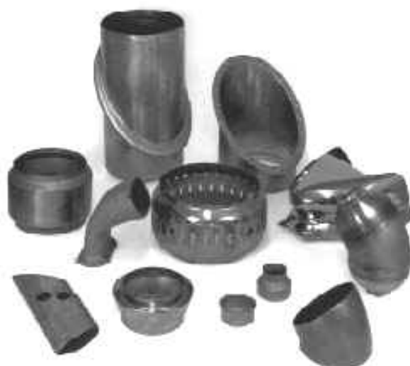
Hydroformage à froid Bulge Forming